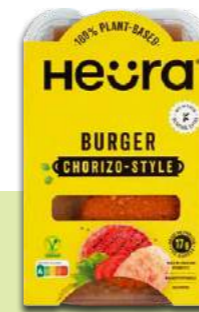
Heura Burger Chorizo Style Testsieger Vegi-Burger

Dies äussert sich in Fettleibigkeit und kardiometabolischen Risiken sowie einem erhöhten Risiko für Typ-2-Diabetes und zahlreiche Krebsformen.