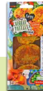
Karma Veggie Patties Testsieger Gemüsepatties

Kontra: Es bleibt ein ultra-verarbeitetes Produkt, das nur gelegentlich verzehrt werden sollte