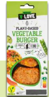
V-LOVE Vegetable Burger Testsieger Gemüsepatties

Kontra: Keine Eisen- und Vitamin-B12-Ergänzung für Veganer